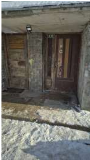
Kāpņu telpas ārdurvis